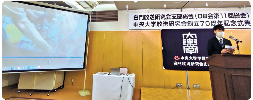
ステージとディスプレイ