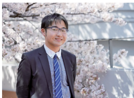
卒業式だったはずの日に、大学で撮影

2020年2月27日 でした。「卒番がコロナウイルスにより中止になりそうです」。当時の番組発表会実行委員長から連絡が入りました。未知の新型ウイルスが広まり始めた当時は重症化率も非常に高く、とにかく「密」を避けようということでした。クエアの施設貸出が全面的に停止されたわけであり、番長はギリギリまで開催できるように走ってくれましたが、最終的に中止が決定しました。