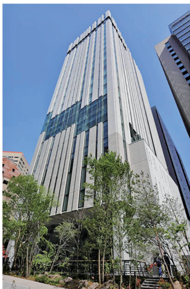
駿河台キャンパス