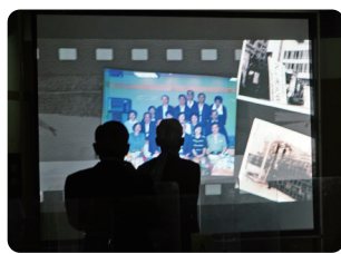
思い出の写真のスライド