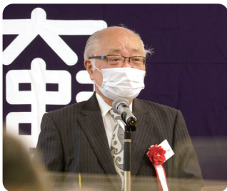
祝辞 久野学員会長