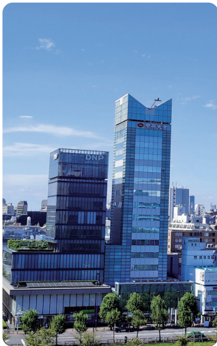
神田川対岸の 中大市ヶ谷町田キャンパス