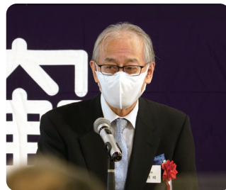
祝辞 石井中央大学常任理事