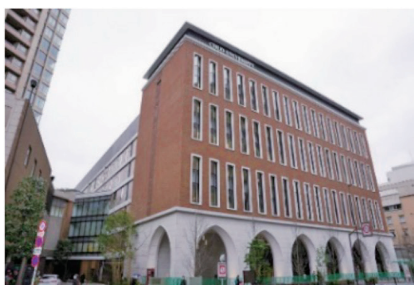
茗荷谷キャンパス