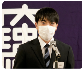
現役挨拶 大川放送研究会会長